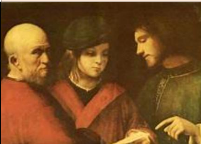
Le Tre età dell'uomo di Giorgione (1478 - 1510) Olio su tavola di pioppo - Galleria Palatina, Firenze

ALL THE LOVE OF THE UNIVERSE dei SANTANA, un titolo che sa di buono, come una focaccia appena sfornata fatta con la ricetta della nonna. In copertina le tre età di Giorgione. L'attribuzione certa a Giorgione è stata spesso messa in dubbio. Se non lo ha dipinto Giorgione lo ha dipinto qualcuno che dipingeva come Giorgione. Di certo c'è che sono rappresentati due figli, un nipote, due padri e un nonno. Giorgione vecchio ci guarda dal quadro. Giorgio e Giorgino osservano un pentagramma. La musica unisce le tre età perché la musica non ha età. RADIO FLO INTERNATIONAL vi augura all the love of the universe in musica.