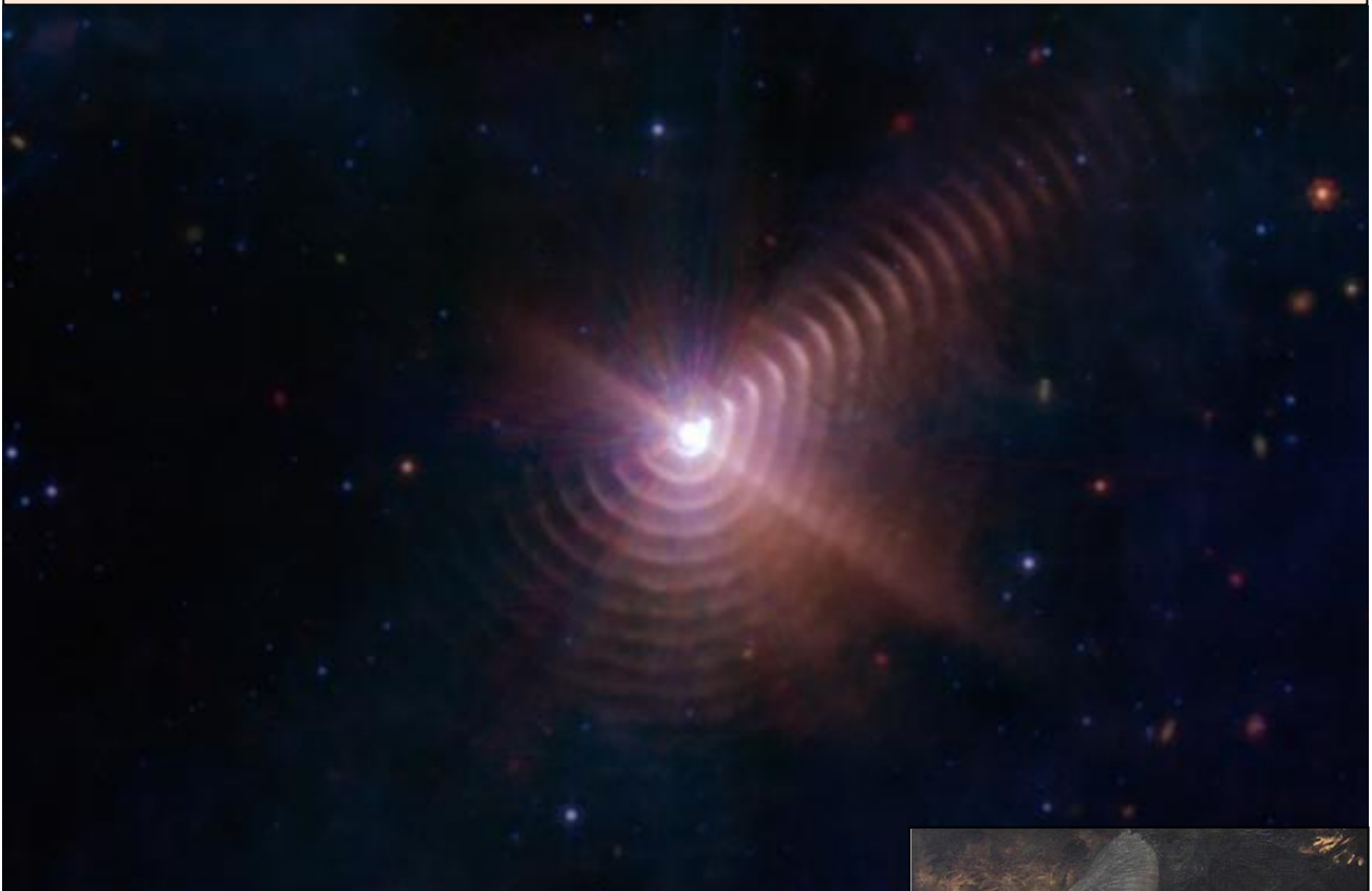
WR140 nella costellazione del Cigno e i suoi fantastici anelli di polvere.

Per le sue caratteristiche intrinseche, la stella Wolf-Rayet genera potenti venti che spingono enormi quantità di gas nello spazio: ogni anello si crea quando, ogni otto anni, le due stelle si avvicinano e i loro venti stellari si incontrano, comprimendo il gas e formando polvere stellare. Come gli anelli del tronco di un albero, le spire di polvere segnano il passare del tempo, a dimostrazione che in natura dal piccolo all'infinitamente grande, non c'è poi in definitiva nulla di nuovo.