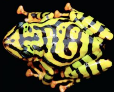
La nuova specie di rana scoperta nella riserva Otonga

Il governo ecuadoregno lo ha insignito con una delle massime onorificenze dello Stato, il «Gran Collar Luis Héctor Chislain de Carondelet y Barón de Carondelet», per essere lo straniero che ha dato un grande contributo alla scienza dell'Ecuador.